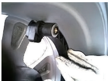
任意で貼付け位置設定可能