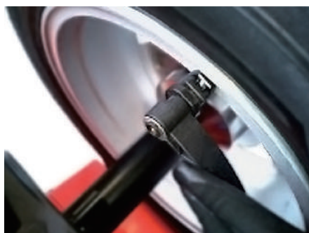
ディスタンス、ホイール径自動入力 ※S350A仕様