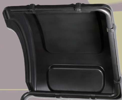
フードはオプション